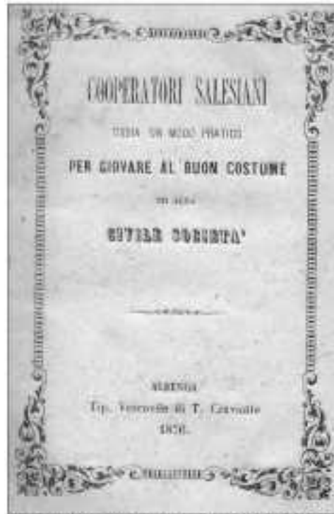
Portada del manual escrito por Don Bosco sobre los Cooperadores Salesianos (1876).